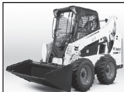
ПОСЛУГИ БОБКАТОМ 067-703-24-31

Вантажні перевезення а/м Вольво (фургон бортовий, довж. причепа - 14м), самоскидами (в/п 1-35т), фурами, а/м ЗІЛ; послуги з розвантаження та завантаження піддонів. Тел. (095)535-56-63, (097)751-64-30.