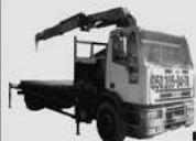
ДОСТАВКА бруківки, блоків, цегли, бетонних кілець, плит перекриття, вагончиків, контейнерів.